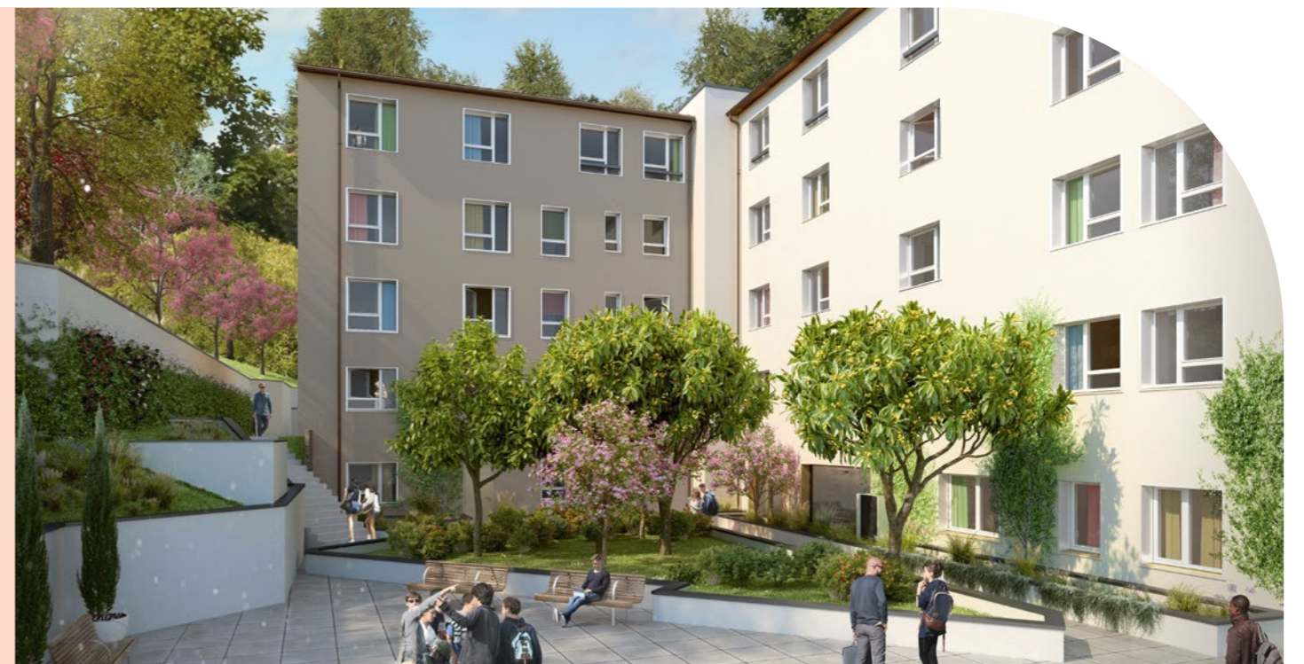
À ROUEN (76), UN ANCIEN ENSEMBLE DE BUREAUX EST RÉHABILITÉ ET TRANSFORMÉ EN UNE RÉSIDENCE ÉTUDIANTS STUDENT FACTORY.