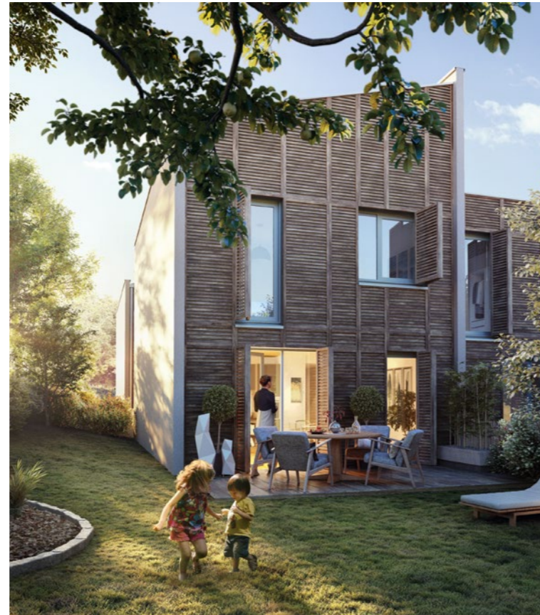
INITIA - RAMONVILLE-SAINT-AGNE (31)

VINCI Immobilier décrypte les nouveaux besoins et revisite en permanence ses concepts pour s'adapter au nouveau rapport à la propriété et au travail, à la répartition des espaces publics et privés, aux nouveaux modes de consommation et de mobilité, en lien avec la nature et à l'adaptation au changement climatique.