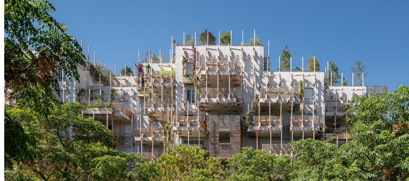
NICE LE RAY - NICE (06)