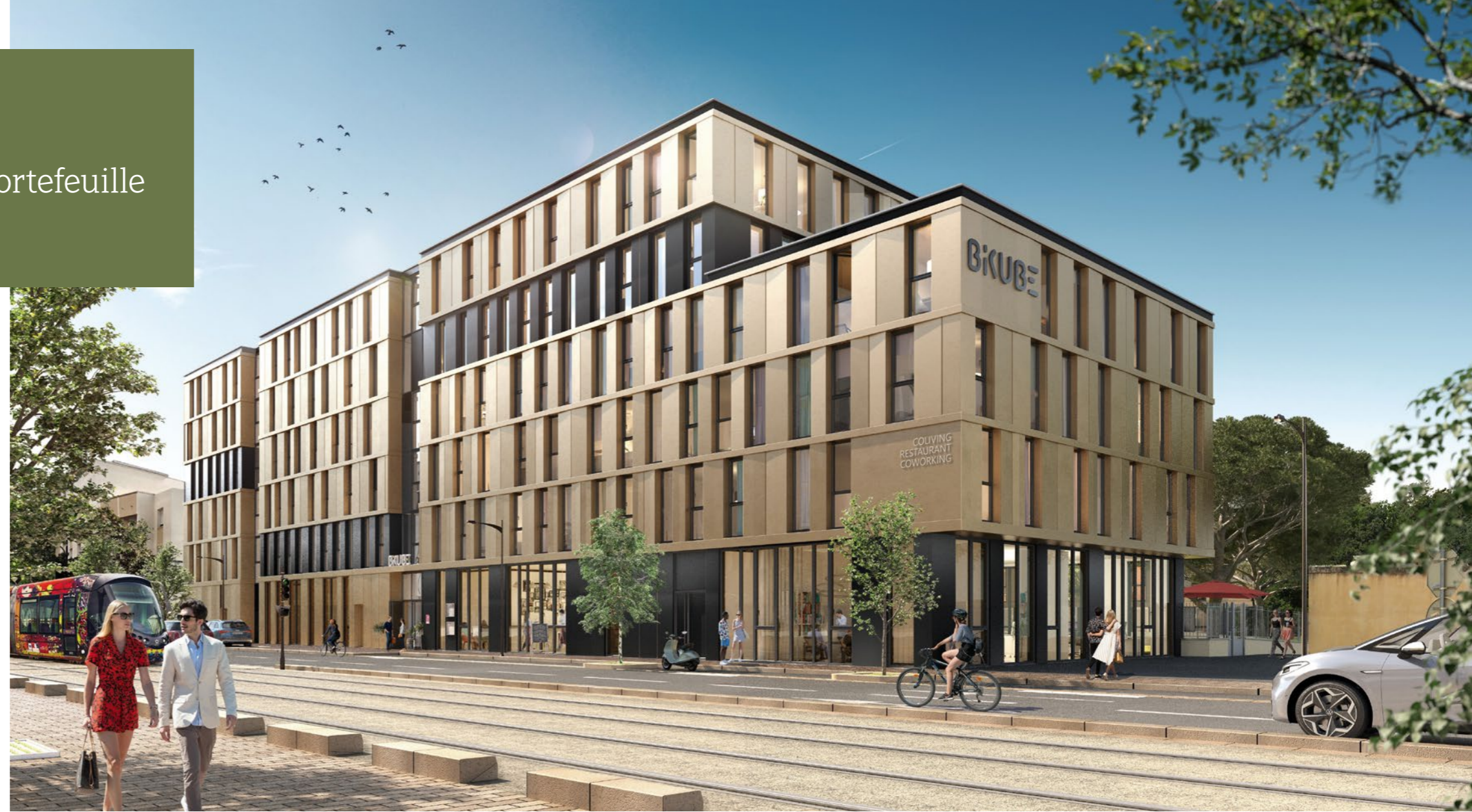
À MONTPELLIER (34), LA RÉSIDENCE DE COLIVING BIKUBE PROPOSE UN MODE D'HÉBERGEMENT FLEXIBLE CENTRÉ SUR LA CONVIVIALITÉ ET LES SERVICES.

Cette opération de recyclage urbain à grande échelle est rendue possible en réalisant une péréquation financière entre les sites à fort potentiel et ceux les moins viables . VINCI Immobilier et son partenaire Brownfields ont acheté en bloc ce portefeuille pour y réaliser une programmation équilibrée et diversifiée. Depuis 2019, sept programmes ont été lancés. Ce recyclage des terrains ENGIE donnera naissance à 2 100 logements, dont trois résidences seniors, une résidence de coliving BIKUBE et deux résidences étudiantes Student Factory sur une surface totale de 355 000 m 2 entièrement dépollués. Le premier programme a été livré à Fécamp avec une résidence intergénérationnelle de 89 logements sociaux sur un site anciennement occupé par une usine à gaz.