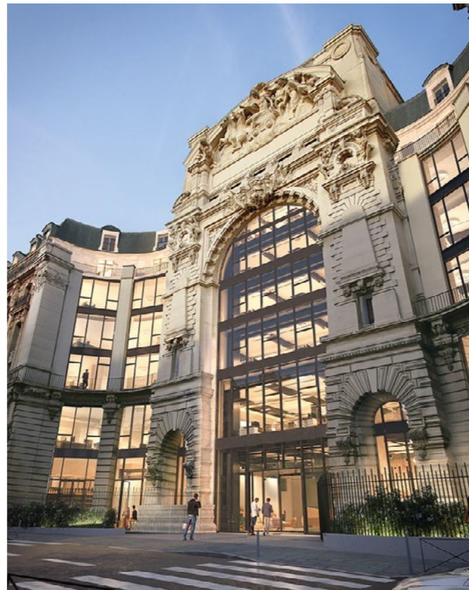
WOW - PARIS (75)

Nous réduisons nos déchets à la source en conservant au maximum les immeubles existants. Nous maximisons le réemploi des déchets de chantier sur site et nous orientons le surplus vers des filières dédiées au réemploi des matériaux. Enfin, nous réutilisons au maximum les terres excavées sur le site pour fertiliser les sols et offrir de la pleine terre utile pour la végétalisation des espaces publics.