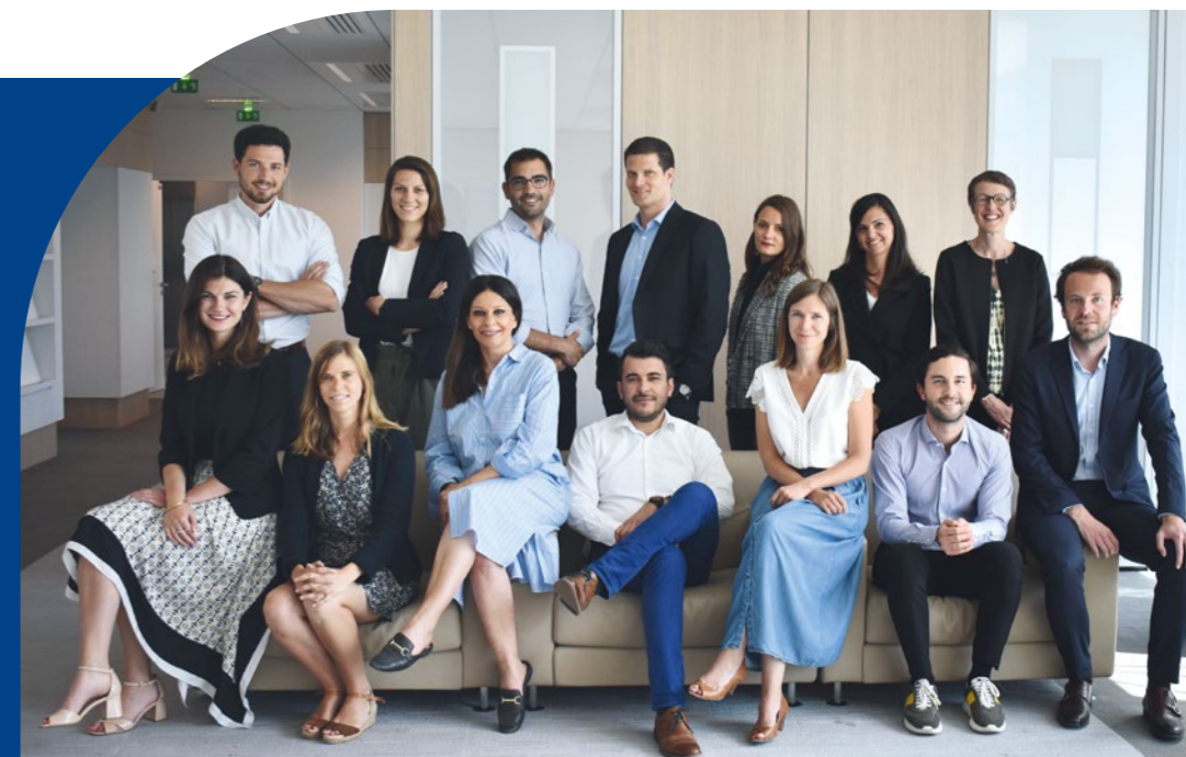
L'ÉQUIPE DU PÔLE AMÉNAGEMENT ET GRANDS PROJETS URBAINS.