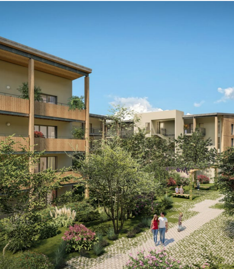
CÔTÉ B - BIGANOS (33)

VINCI Immobilier est le premier promoteur à s'engager pour le zéro artificialisation nette des sols dès 2030. Le Groupe renonce aux opérations qui artificialisent le plus, privilégie le recyclage urbain et intègre la biodiversité dans tous ses projets.