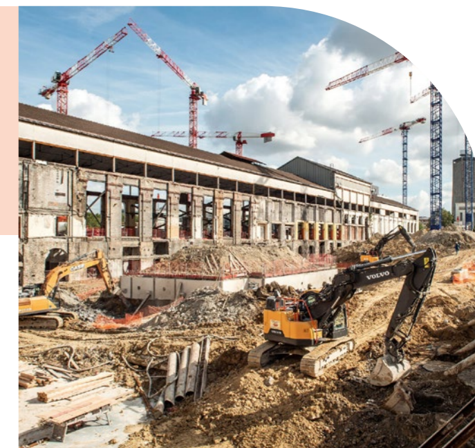
UNIVERSEINE - SAINT-DENIS (93)

Résultat : vous êtes déchargé de toute responsabilité, quels que soient la décision du préfet et les usages futurs du site.