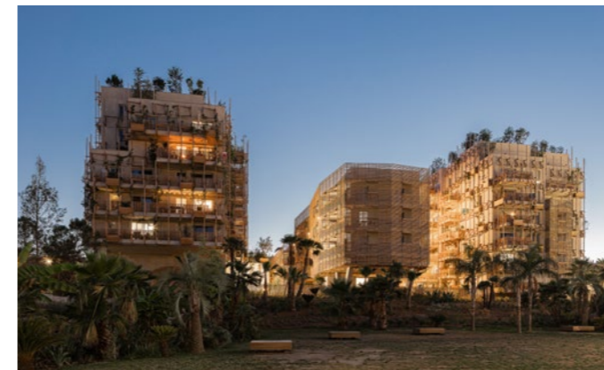
NICE LE RAY - NICE (06)

En 2050, le climat de Paris sera celui de Madrid aujourd'hui. Pour livrer des bâtiments vivables dans 40 ou 50 ans, nous réalisons des projections climatiques en 2050 sur la base de fichiers locaux de Météo France. Région par région et territoire par territoire, nous adaptons nos programmations au climat de demain.