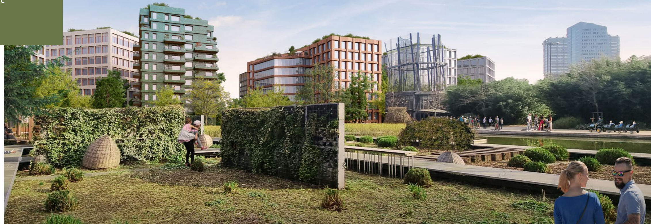
METROPOLITAN SQUARE, À LILLE (59), CONÇU PAR LES CABINETS D'ARCHITECTURE MANUELLE GAUTRAND ARCHITECTURE, SAISON MENU ARCHITECTES URBANISTES ET O ARCHITECTURE.

Le projet urbain, porté par VINCI Immobilier et BNP Paribas Real Estate, consiste en la création d'un morceau de ville en hybridant les espaces et en renaturant le quartier. Il combine toutes les réponses immobilières pour donner vie à un quartier mixte et animé . Lille Metropolitan Square vise la sobriété environnementale avec l'objectif, notamment, de réemployer et de recycler sur site des terres excavées pour fertiliser le sol et accueillir la végétation. Un boisement couvrira la presque totalité des terrains libres pour créer un corridor écologique afin d'optimiser la gestion de l'eau et rafraîchir les espaces.