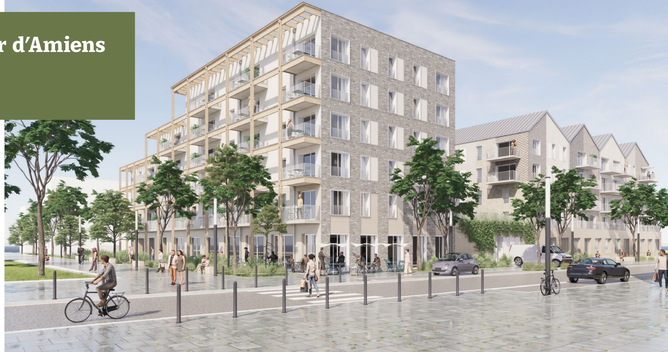
À AMIENS (80), VINCI IMMOBILIER ET LE GROUPE DUVAL AMÉNAGENT 6 HECTARES DE LA ZAC GARE LA VALLÉE.

Ici, nous agrégeons toutes les expertises de VINCI Immobilier pour requalifier et impulser un nouvel élan à un quartier entier. Livraison à partir de 2025.