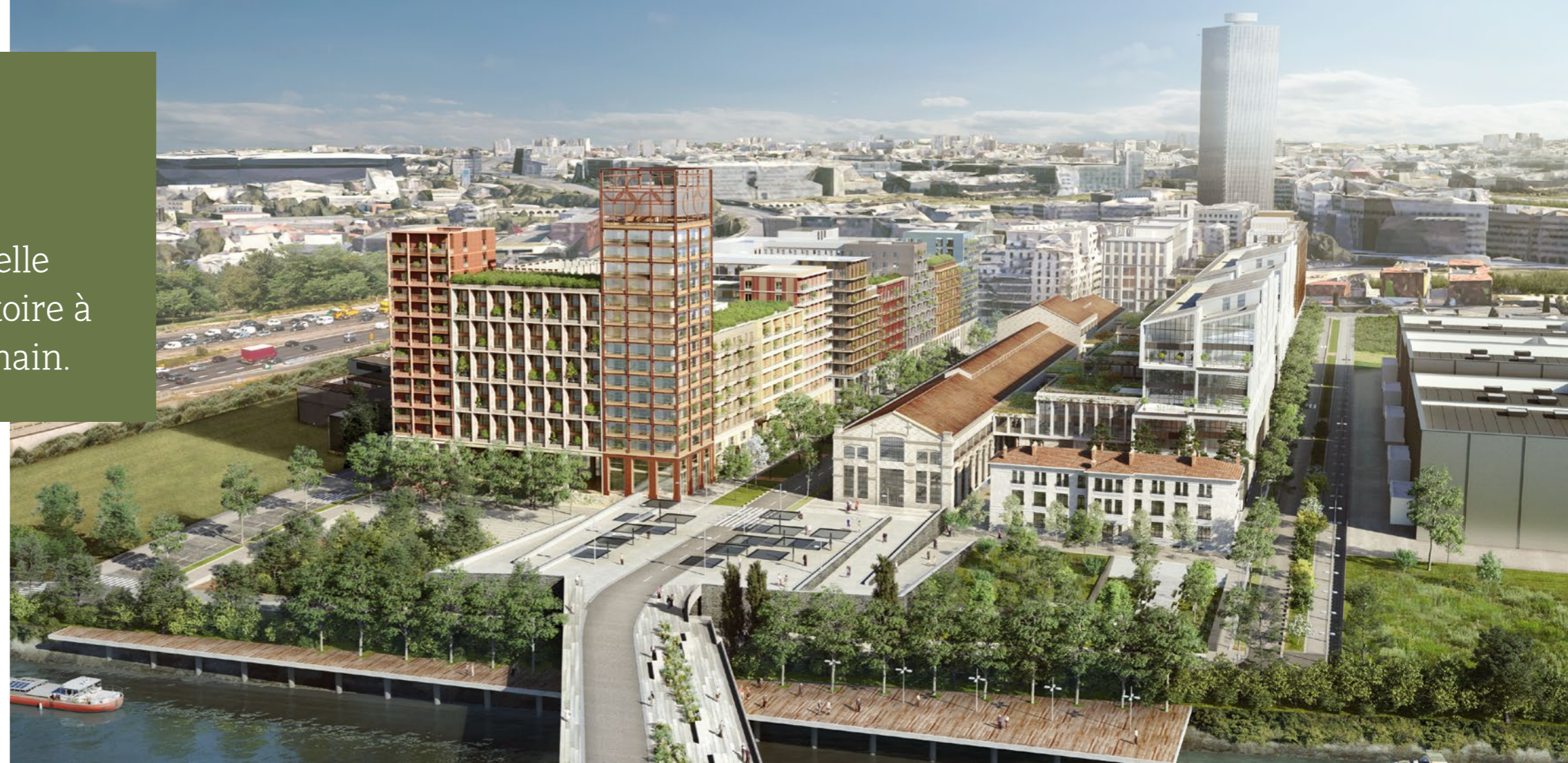
À SAINT-DENIS (93), UNIVERSEINE EST UN PROJET D'AMÉNAGEMENT ET DE REQUALIFICATION D'UNE FRICHE INDUSTRIELLE D'OUÛ ÉMERGERA UN NOUVEAU QUARTIER DE VIE DURABLE.

L'objectif est d'assurer un héritage durable des Jeux dans le cadre d'un projet urbain préalablement défini en concertation avec les collectivités territoriales. Ce permis à double état permet de créer le Village des athlètes pour les événements sportifs de 2024 et de le transformer, dès 2025, en un quartier mixte et pérenne.