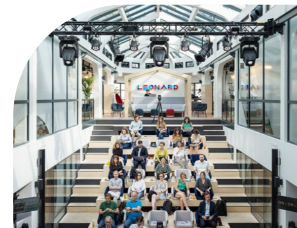
LEONARD, L'INCUBATEUR DU GROUPE VINCI

Leonard est un incubateur de startups qui projette la ville et le Groupe dans un horizon de 5 à 10 ans. Ses missions : une veille sur toutes les tendances émergentes, une démarche prospective, l'incubation de programmes et l'accélération de projets innovants.