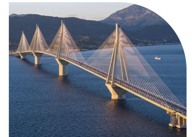
PONT, GEFYRA (GRÈCE)

VINCI Immobilier bénéficie des savoir-faire et des innovations des filiales de VINCI en dépollution, biodiversité, viabilisation, infrastructures de mobilité, ou encore, en matériaux bas carbone. Ensemble, ces expertises permettent de fabriquer, dès aujourd'hui, la ville de demain.